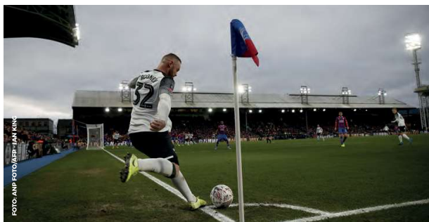
DERBY COUNTY-AANVALLER WAYNE ROONEY NEEMT EEN CORNER TIJDENS DE FA CUP-WEEDSTRID TEGEN CRYSTAL PALACE, JANUARI 2020.

Maar de onverzadigbare honger naar sponsorinkomsten primeert in het voetbal boven de bezorgdheid over het welzijn van de fans, laat staan de shirtverkoop. Zo haalde Championship-ploeg Derby County FC in 2019 nationaal topscorer Wayne Rooney terug uit de MLS. Of eigenlijk was het shirtsponsor en gokbedrijf 32Red dat Rooney terug naar Engeland haalde. Om het rugnummer 32 op hem te plakken als wandelend (op het terrein soms ook nog weleens lopend) reclamebord voor het bedrijf. Sceptici en andere azijnpissers die suggereerden dat het hier eerder om een marketingtransfer dan om een voetbaltransfer ging, werden afgepoeierd: het ging absoluut niet om een marketingstunt! Verder werd er in alle toonaarden ontkend dat Rooney's buitensporige loon van 90.000 pond door 32Red zou worden opgehoest. Ergens klonk het zelfs: "It was organic and didn't feel manufactured." Oef.